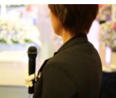
プロデュース科・司会者