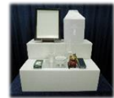
後飾り祭壇・仏具